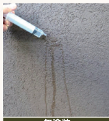
無塗装 無塗装だと雨水をはじ きます。