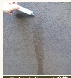
ロイヤルヴェール塗装 雨水が馴染んで汚れと 一緒に流し落とします。